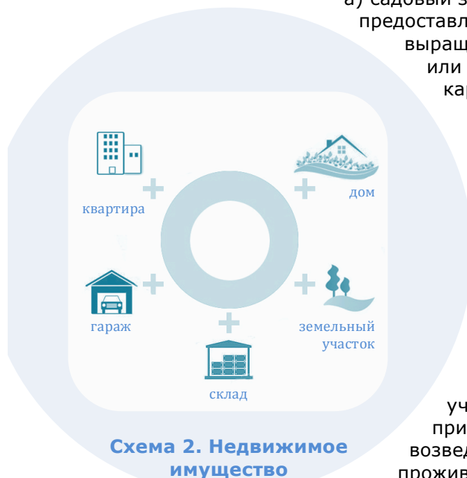
Схема 2. Недвижимое имущество